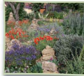
Artenreicher heimischer Steingarten ist eine Wohltat.

Wo wir auch hinsehen entdecken wir nordamerikanische Thuja, asiatischen Bambus oder hochgezüchtete Sorten von Geranien, Stiefmütterchen und dergleichen. Dabei sind in Deutschland über 4.000 Pflanzenarten heimisch! Nur etwa 60 davon werden regelmäßig in Gartencentern angeboten. Durch diese Eintönigkeit vergessen wir mehr und mehr, wie wunderschön unsere Natur gleich vor der Haustür sein kann.