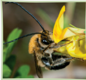
Juni-Langhornbiene an Hornklee

Sie müssen aus Ihrem Garten keine Wildnis und kein Naturschutzgebiet machen, damit es den Bienen gefällt! Die kleinen Summer freuen sich schon, wenn Sie neben Ziergewächsen auch heimische Stauden und Gehölze pflanzen. Es ist oft leichter als Sie glauben!